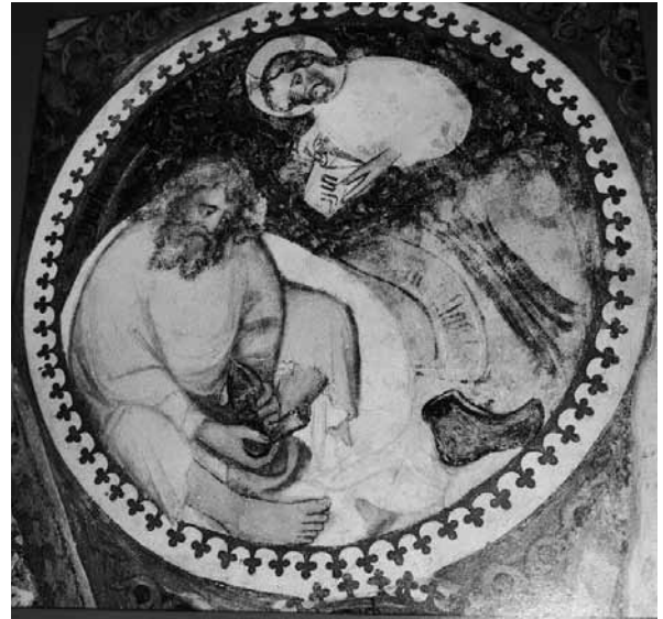
Die Berufung des Mose am brennenden Dornbusch (Brixner Kreuzgang, Arkade IX).

Berufung des Mose am brennenden Dornbusch, das andere die Geburt Jesu im Stall zu Betlehem.