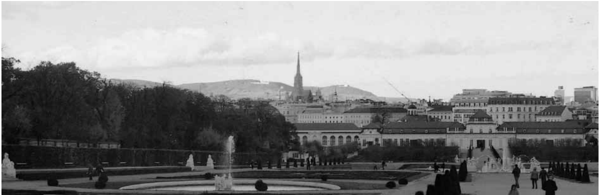
Blick vom Oberen Belvedere zum Leopoldsberg (rechts vom Südturm des Stephansdoms, links der Kahlenberg).