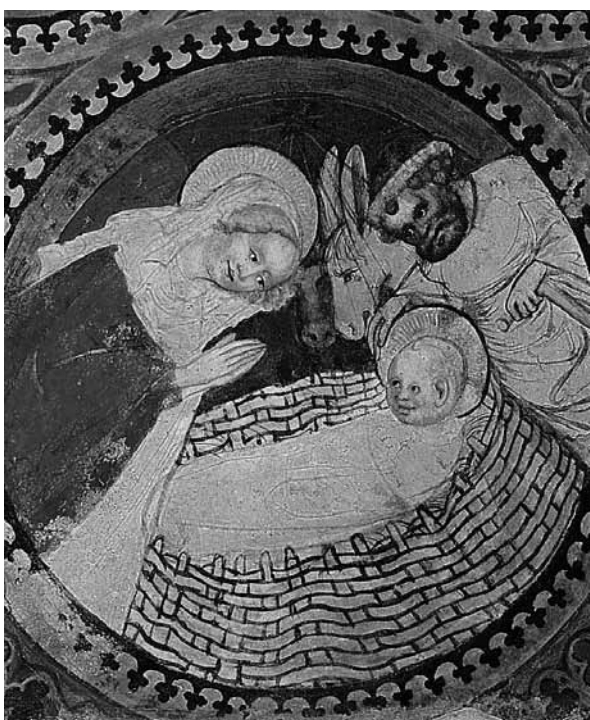
Jesus, der neue Mose, im Weidenkörbchen (Brixner Kreuzgang, Arkade IX).

damals war Quirinius Statthalter von Syrien. Da ging jeder in seine Stadt, um sich eintragen zu lassen. So zog auch Josef von der Stadt Nazaret in Galiläa hinauf nach Judäa in die Stadt Davids, die Bethlehem heißt; denn er war aus dem Haus und Geschlecht Davids. Er wollte sich eintragen lassen mit Maria, seiner Verlobten, die ein Kind erwartete. Als sie dort waren, kam für Maria die Zeit ihrer Niederkunft, und sie gebar ihren Sohn, den Erstgeborenen. Sie wickelte ihn in Windeln und legte ihn in eine Krippe, weil in der Herberge kein Platz für sie war“ (Lk 2,1-7).